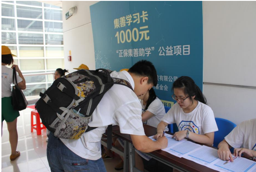
图为项目受助者在志愿者的帮助下登记领取学习卡