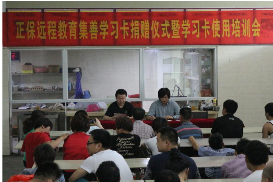
图为受助人参加项目使用培训会