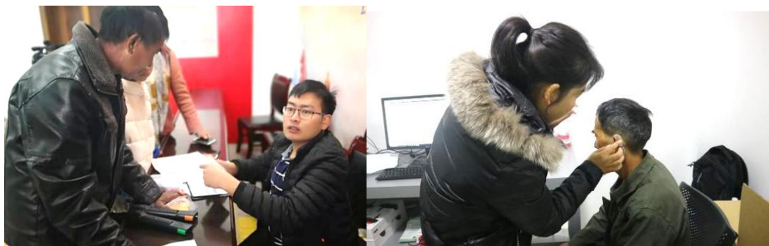
中国残基金会有关同志和云南县委县政府领导出席项目捐赠活动，向听障残疾人和困难群众发放助听器。听力专家和项目培养的本县听力师共同为受助对象验配调试安装助听器，受助对象普遍满意。