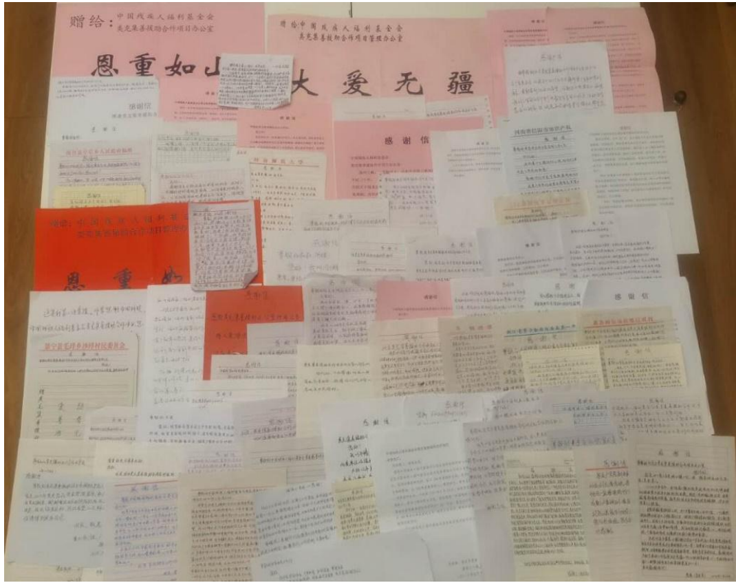
图为患者寄来的感谢信（部分）