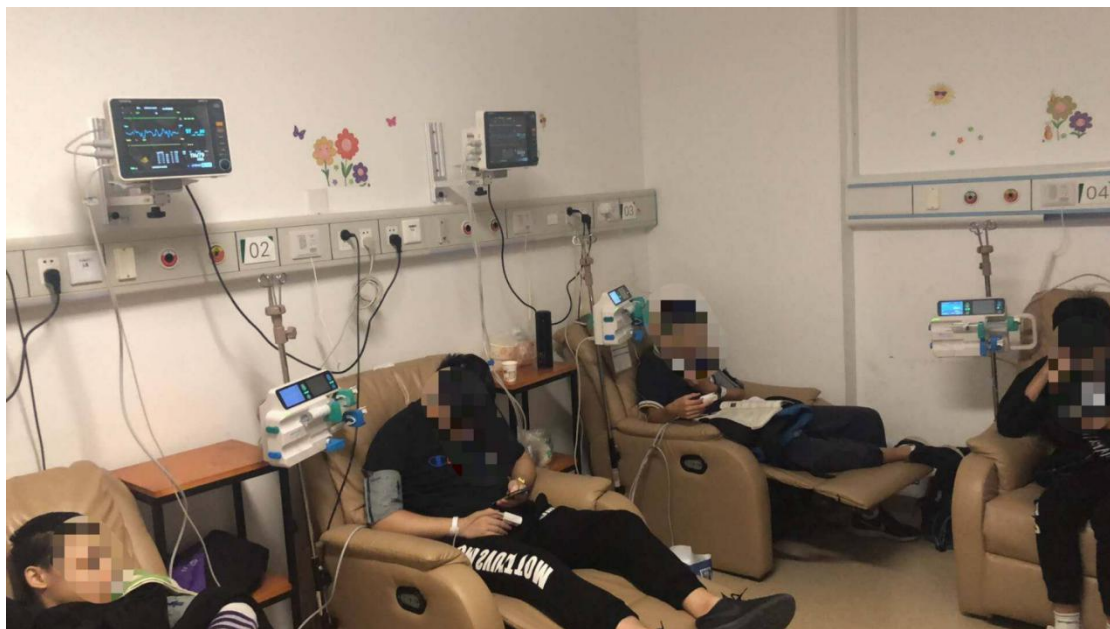
图为患者接受药品输注现场