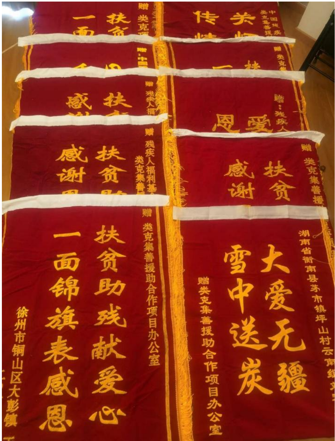
图为患者寄来的锦旗