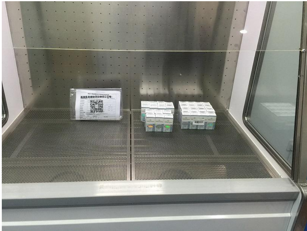
图为援助药品的保存环境