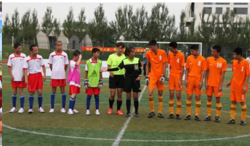
图为第二届赛事图片