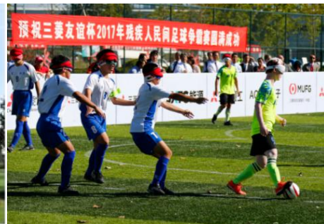
图为第三届赛事图片