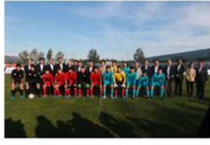
图为第一届赛事相关图