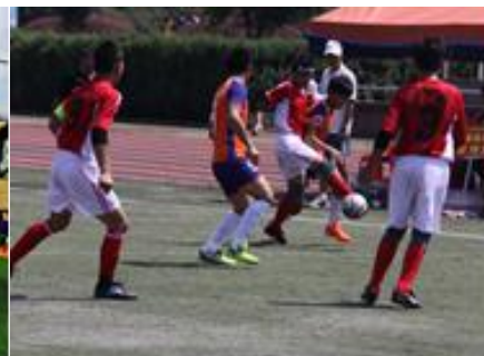
图为第四届赛事图片