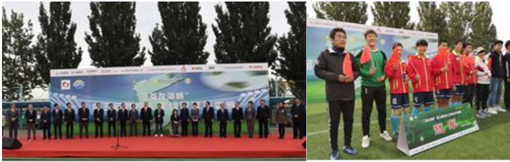
图为第五届赛事图片