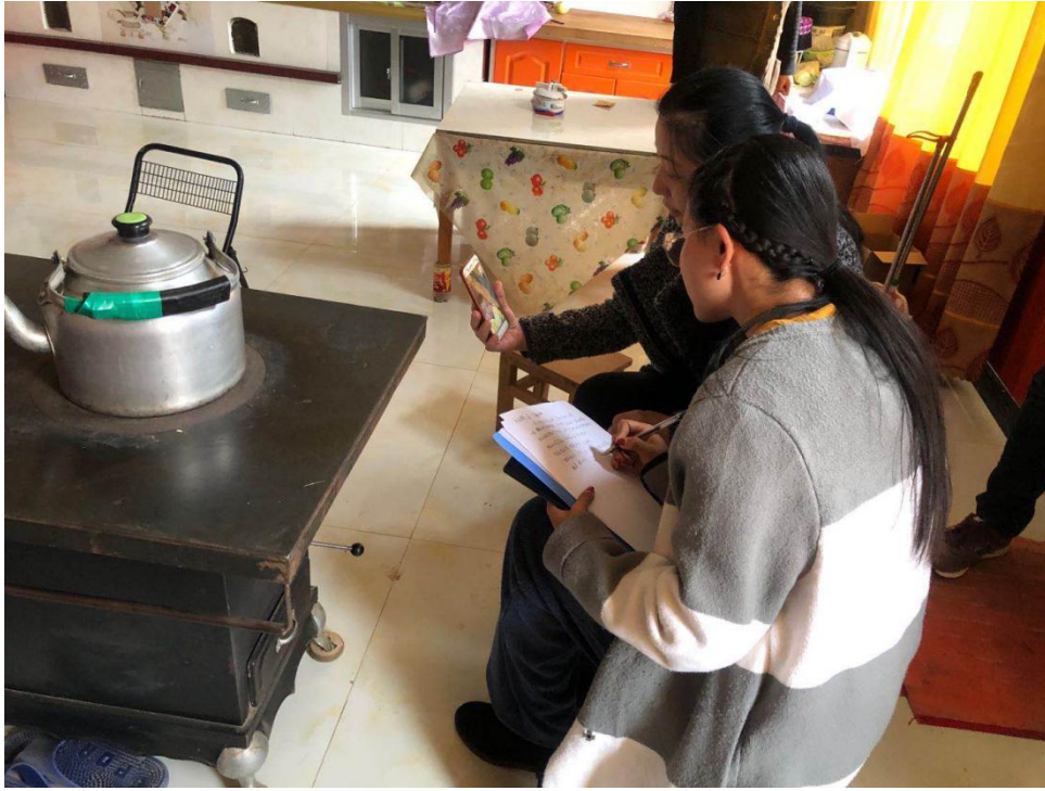
图为项目组入户开展调研筛查