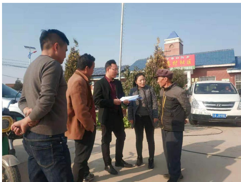
图为项目组入户开展调研筛查