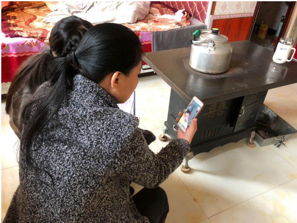
图为项目组入户开展调研筛查