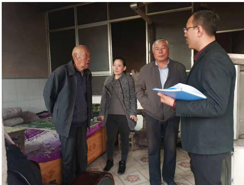
图为项目组入户开展调研筛查