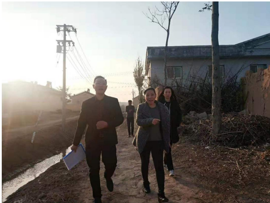
图为项目组入户开展调研筛查