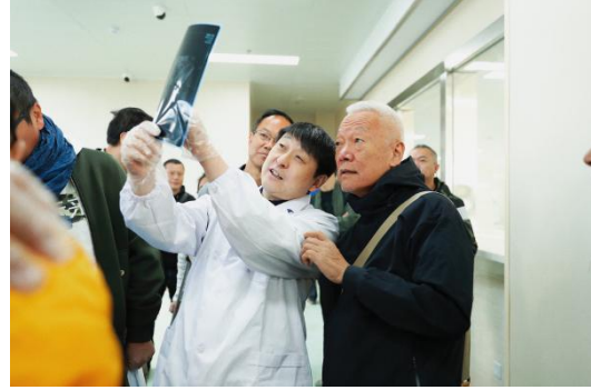
医生团队筛查照片