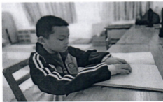
图为柳州市特教学校盲生在借阅读