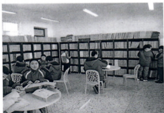
图为开封市特教学校盲生在借阅读