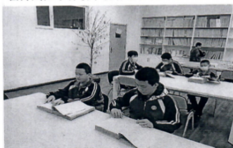
图为呼和浩特市特教学校盲生在摸读