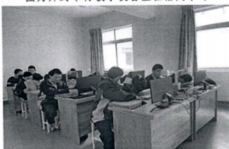
图为咸阳市特教学校盲生在使用读屏软件