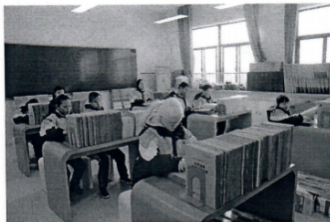
图为扬州市特教中心盲生在阅览室借阅读