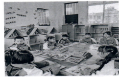
图为射洪县特教学校盲生在借阅读学习