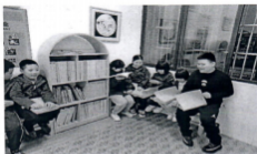
图为绵阳市涪城区特教学校部分盲生在借阅读