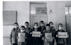
图为伊犁市特教学校盲生感谢爱心捐赠