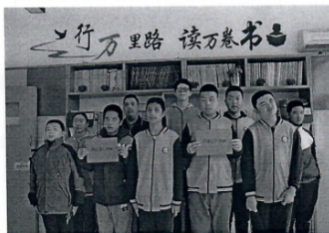
图为潍坊市盲童学校盲生感谢爱心捐赠