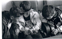
图为盐源县特教学校盲生在使用听书机