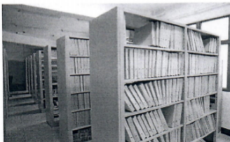
图为连云港市特教学校盲文阅览室内景