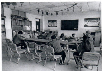
图为东营市特教学校盲生在“观看”无障碍电影