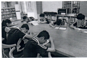
图为湛江市特教学校盲生在阅览室内借阅读