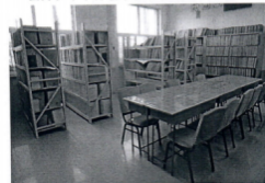
图为赤峰市特教学校盲文阅览室