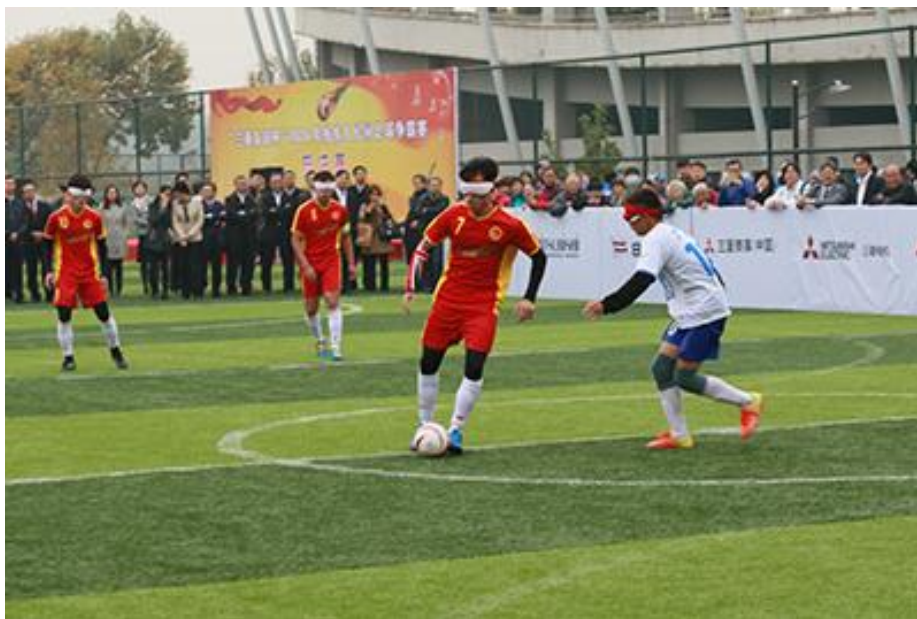
图为第四届“三菱友谊杯”盲人足球比赛现场