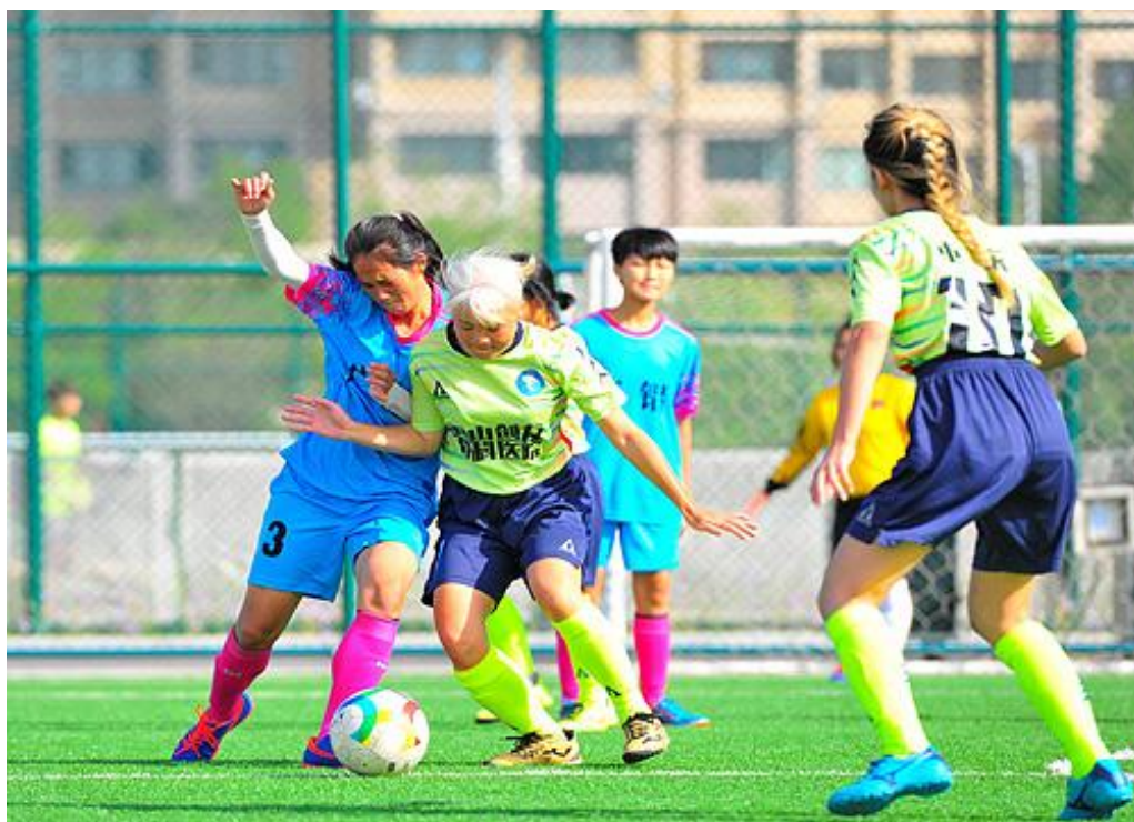
图为三菱友谊杯第四届残疾人民间足球争霸赛年终总决赛聋足女队员赛场风采