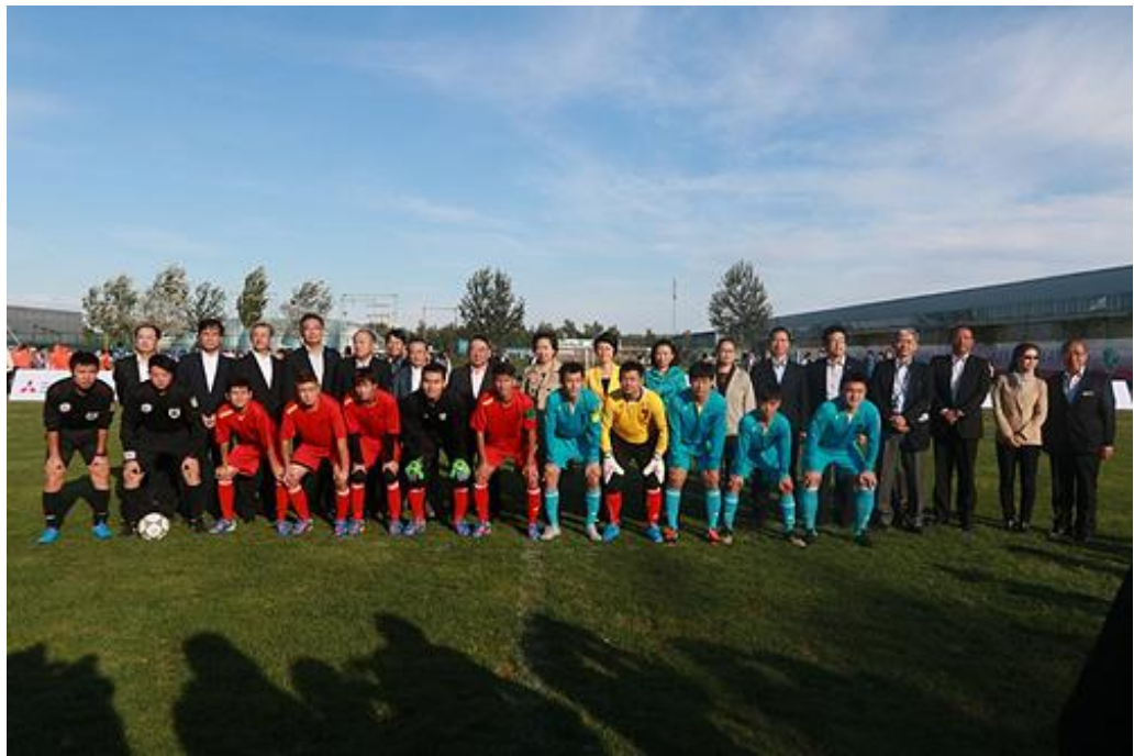
图为第一届“三菱友谊杯”开始仪式