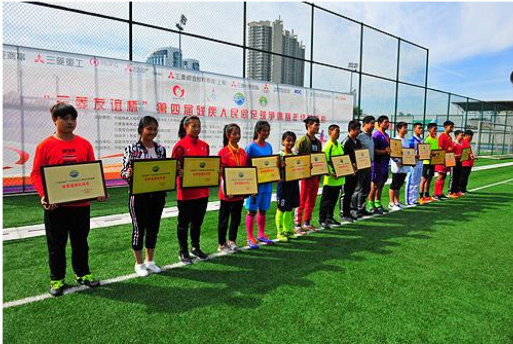
图为“三菱友谊杯”第四届残疾人民间足球争霸赛年终总决赛颁奖仪式