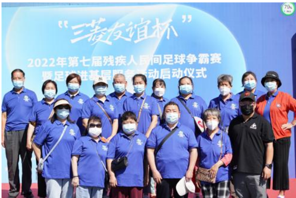
第七届三菱友谊杯足球赛开赛仪式