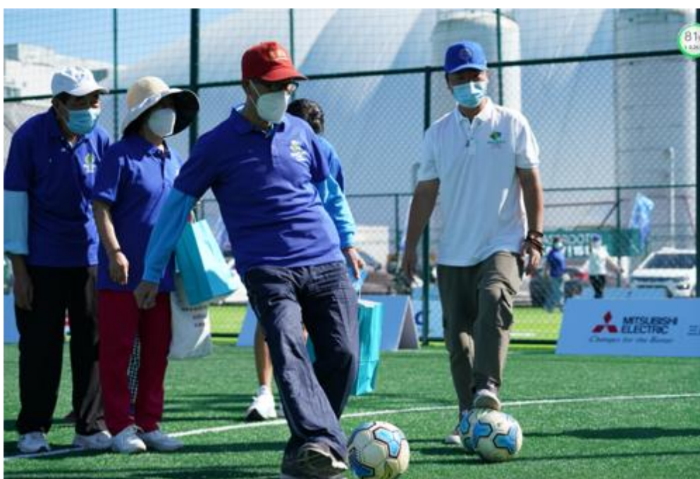
第七届三菱友谊杯足球赛线下体验活动