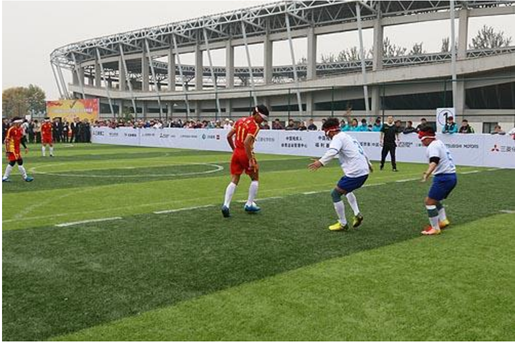
图为第二届“三菱友谊杯”比赛现场