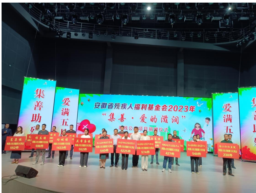
图为安徽物资发放现场