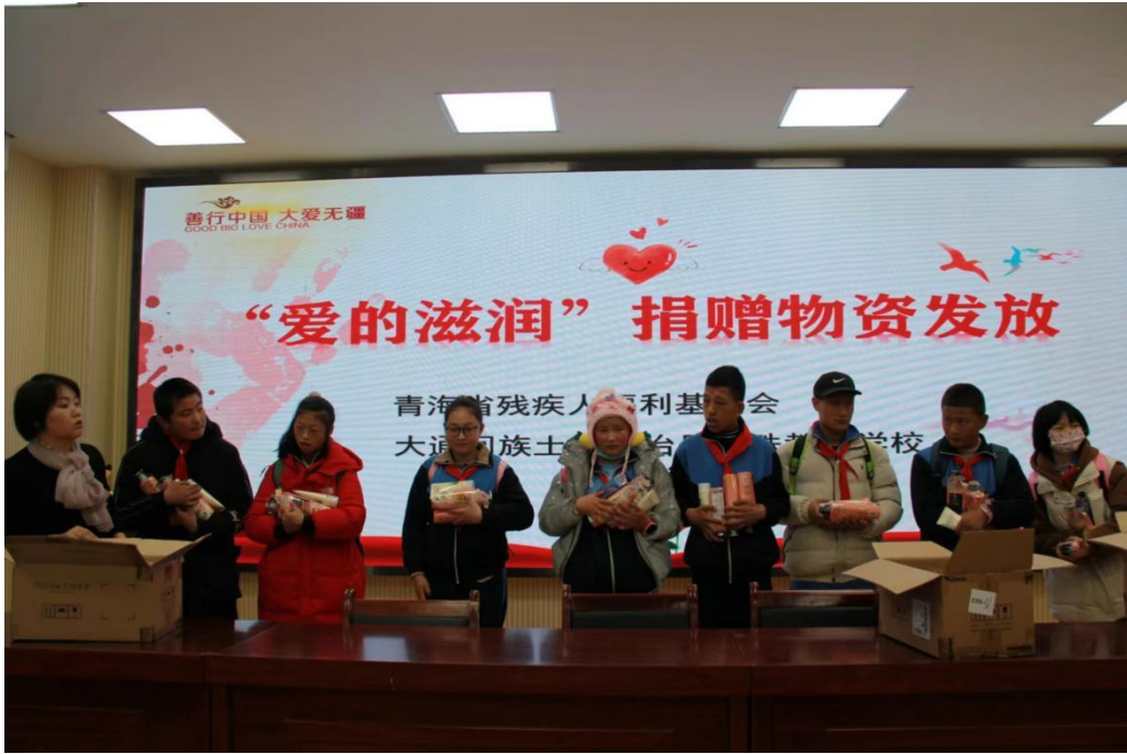
图为青海物资发放现场