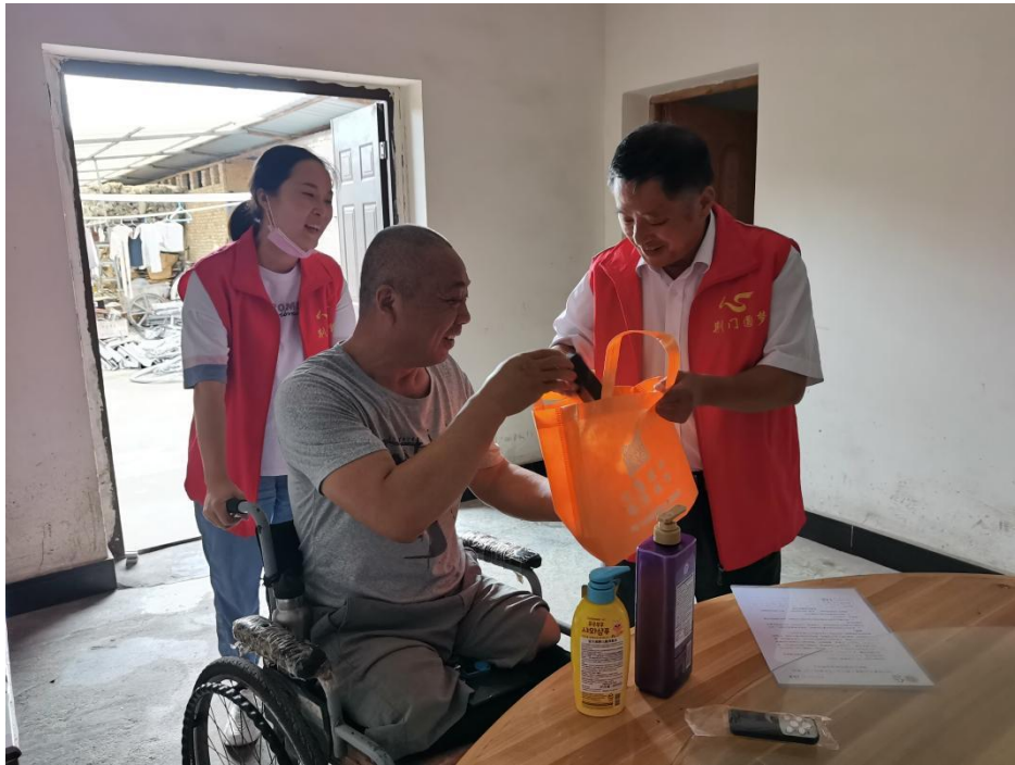
图为湖北省物资发放现场