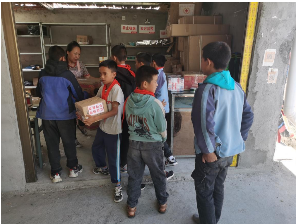
图为四川凉山文翰小学发放现场