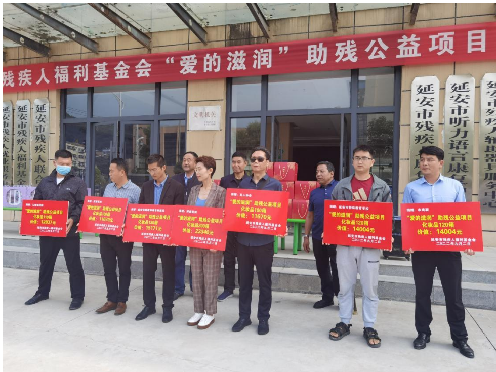
图为延安物资发放现场