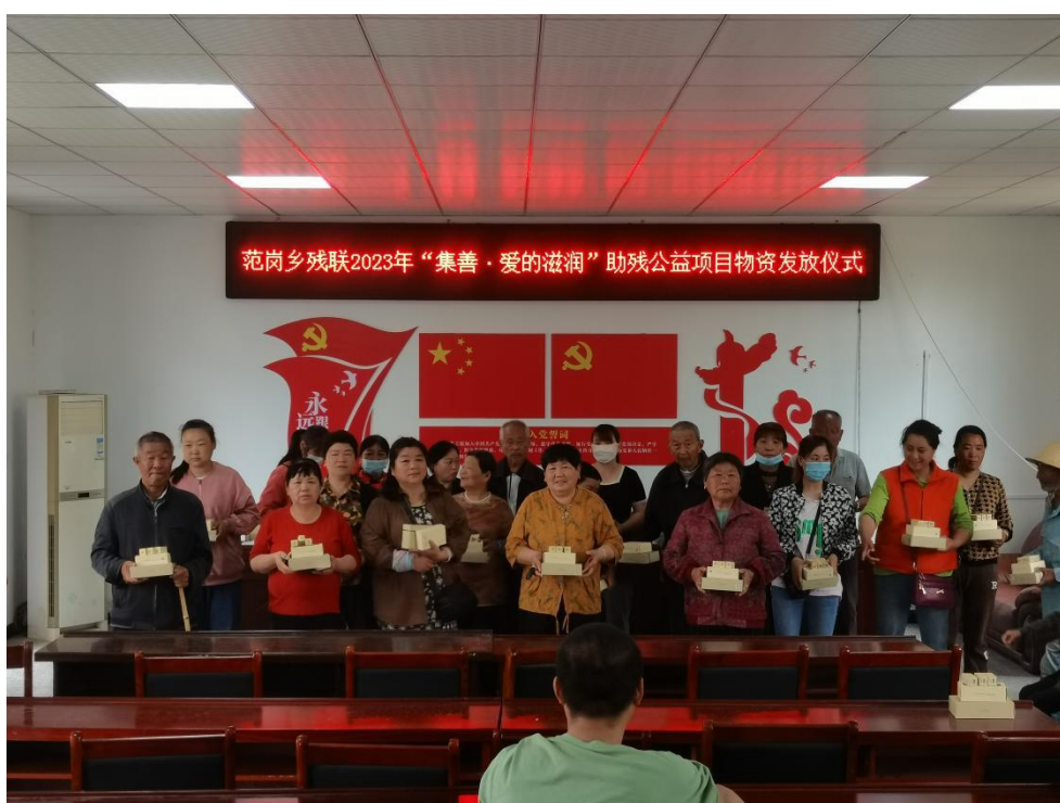
图为安徽物资发放现场