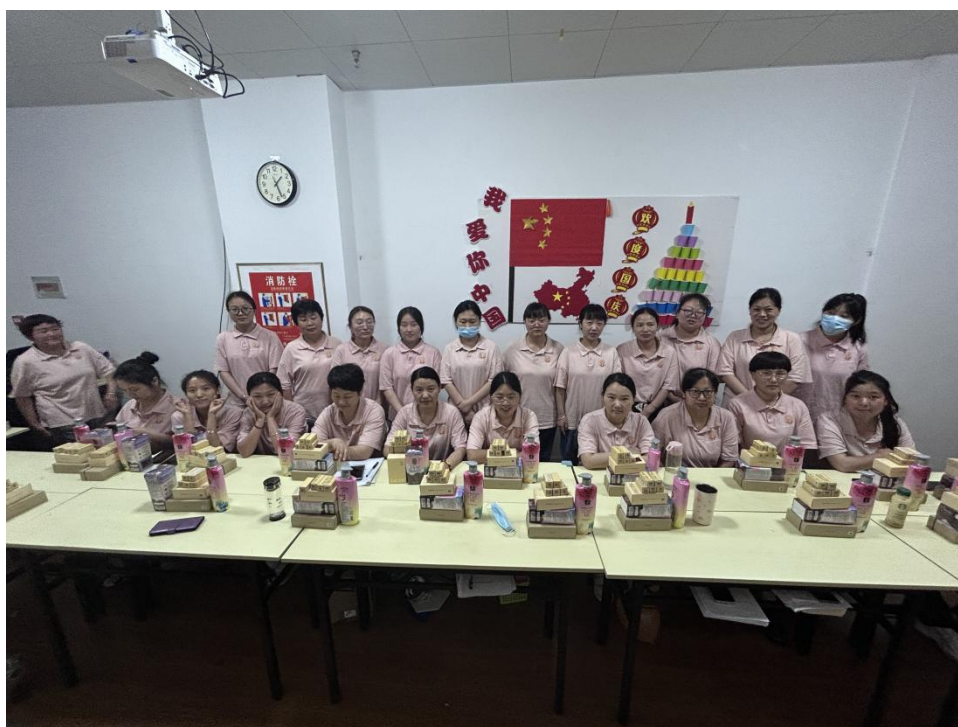
图为安徽物资发放现场