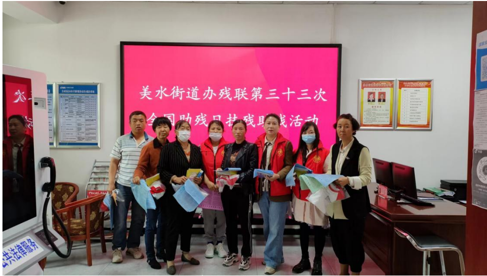
图为延安物资发放现场