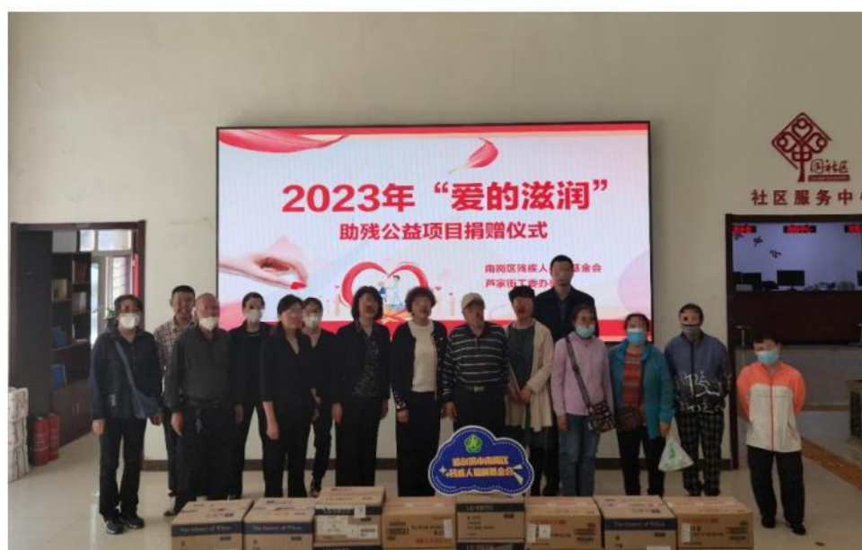
图为哈尔滨物资发放现场