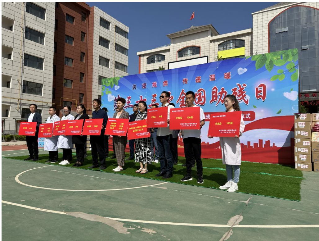
图为延安物资发放现场