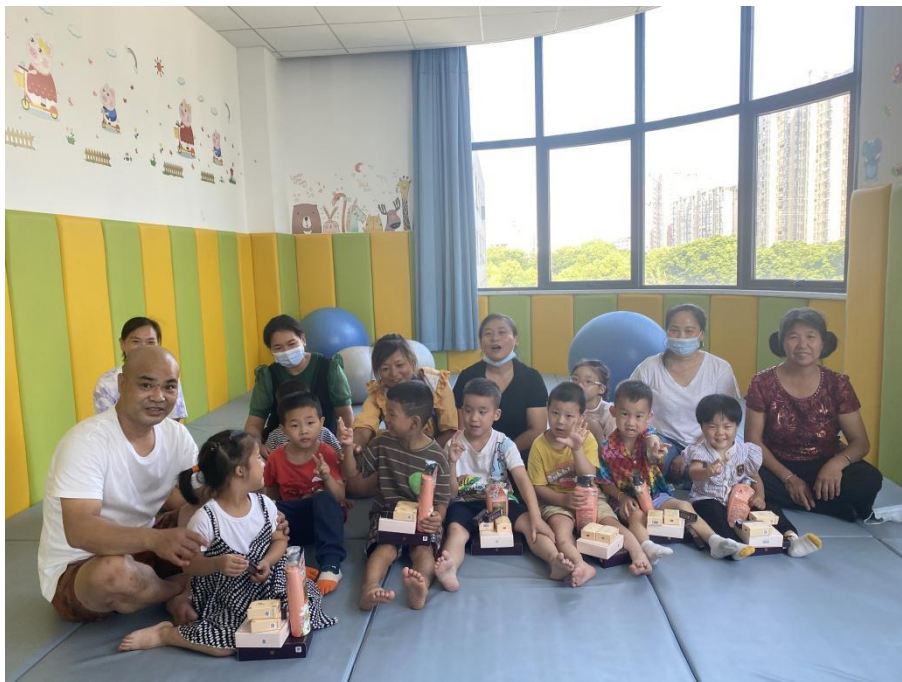
图为湖北省物资发放现场