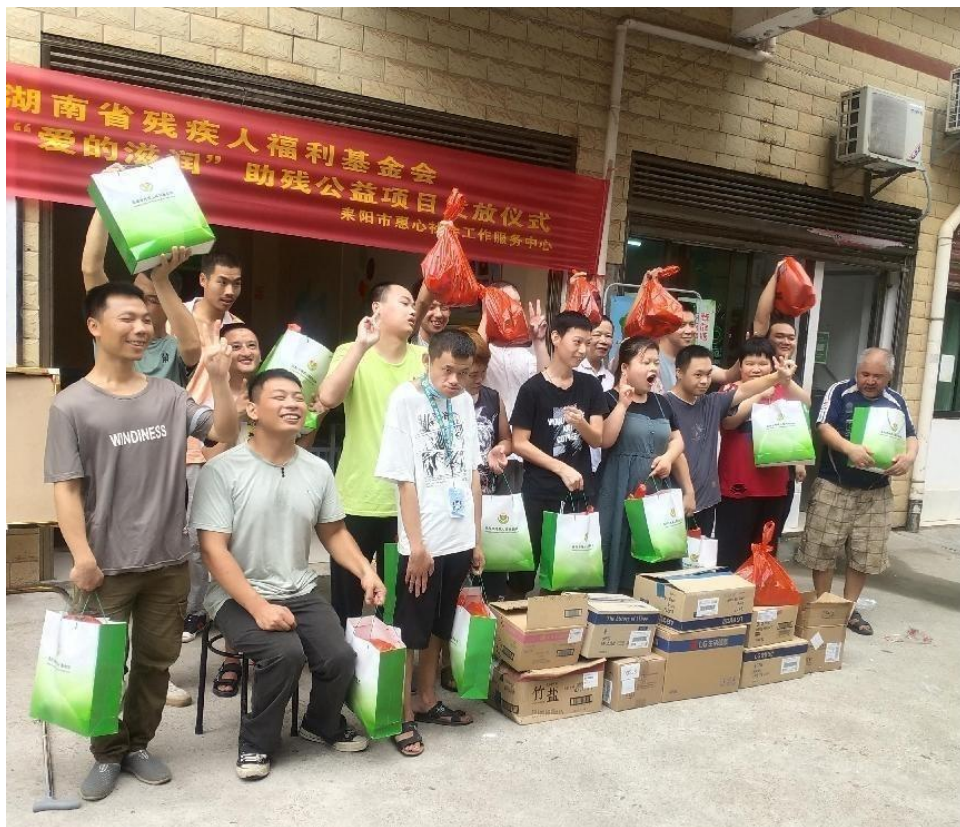
图为湖南省物资发放现场