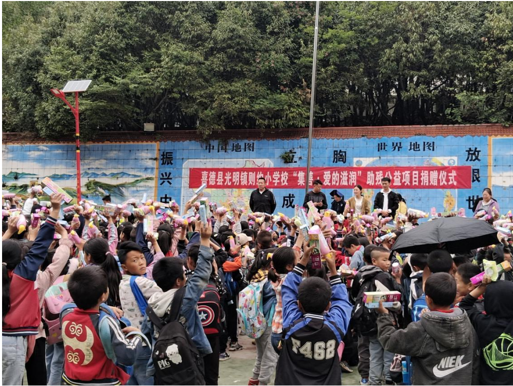
图为四川凉山则约小学发放现场