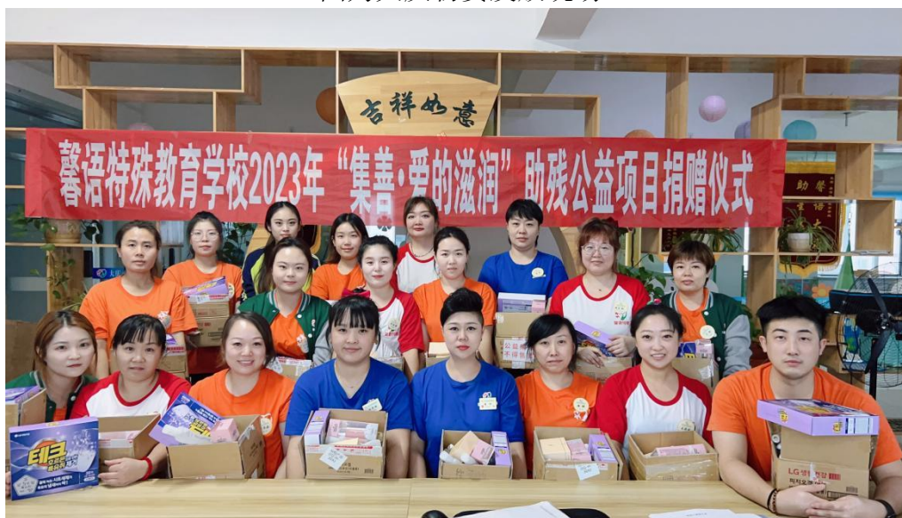
图为大庆物资发放现场