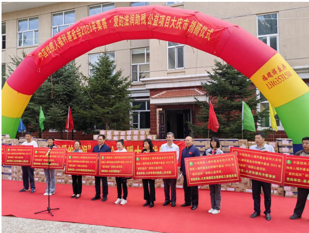
图为大庆物资发放现场