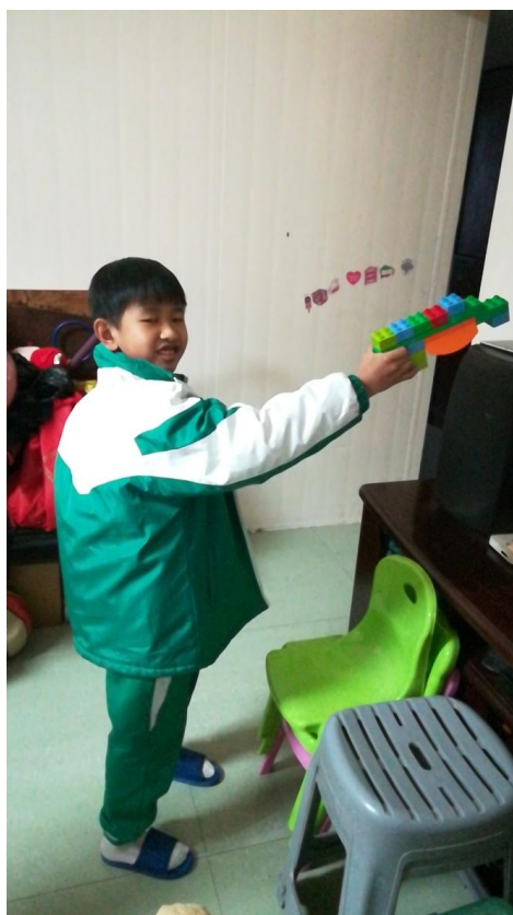
小海拼装的奥特曼的变身器