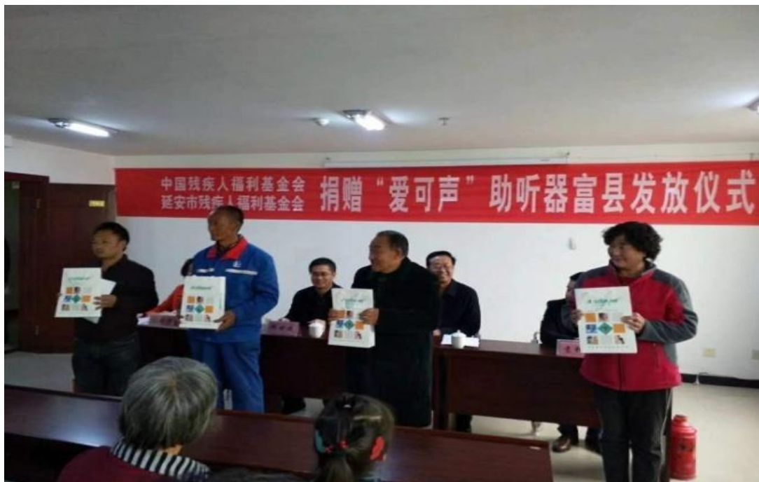
图为发放仪式现场