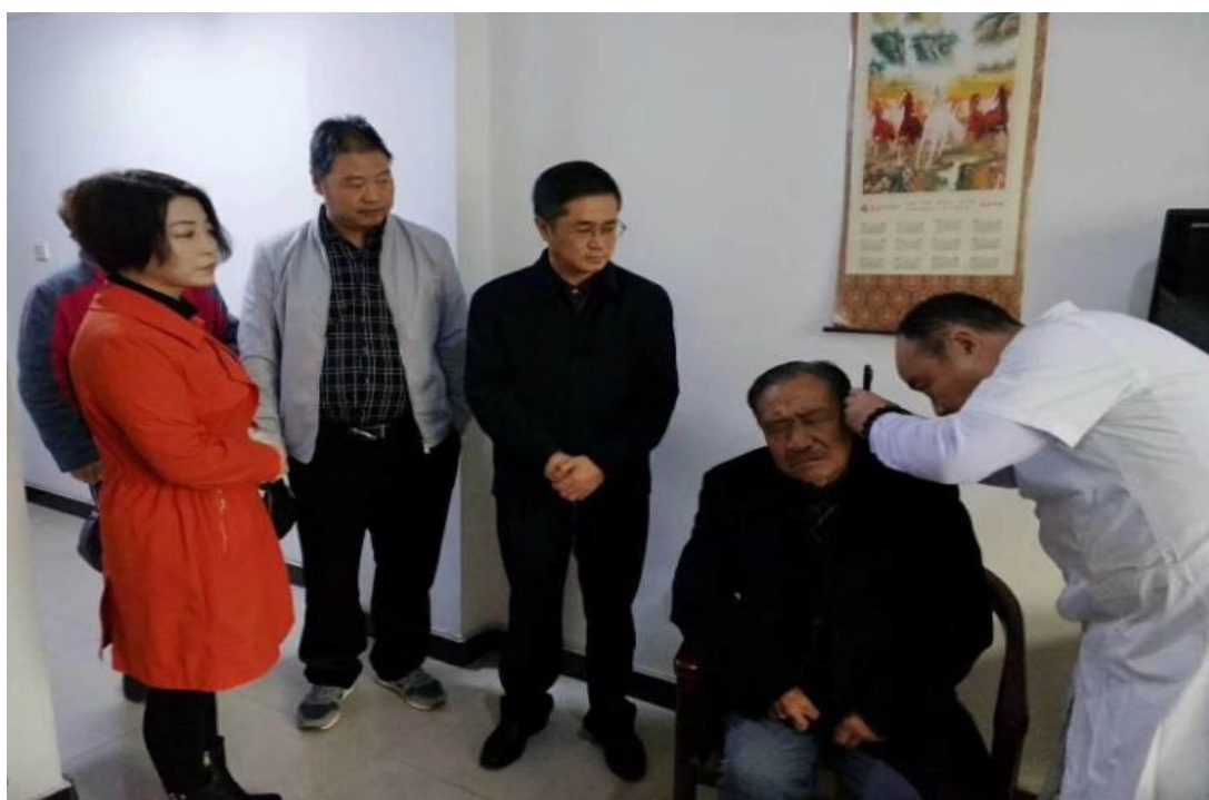
图为听力残疾人正在验配助听器