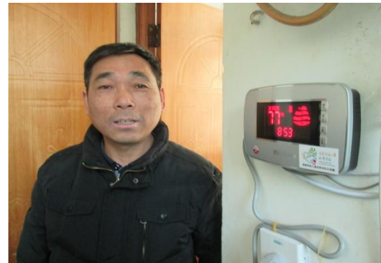
图为残疾人家庭太阳能捐赠项目