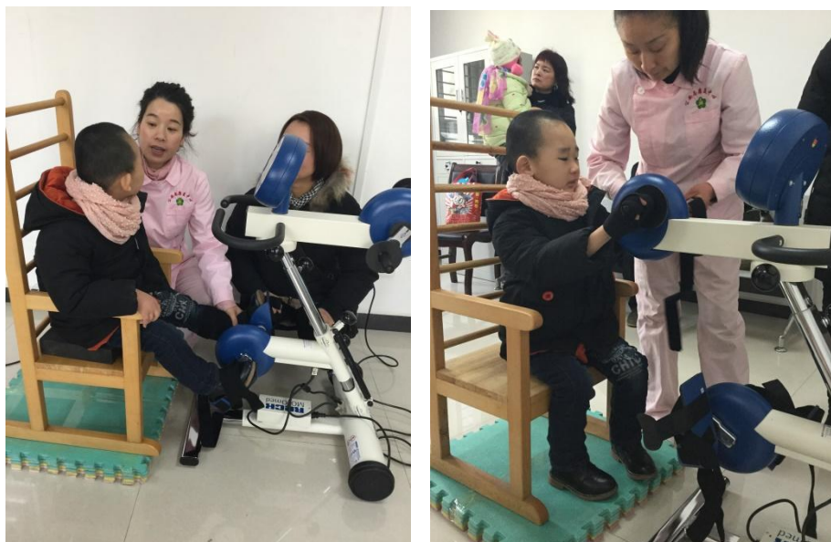
图为康复中心捐赠康复器材项目