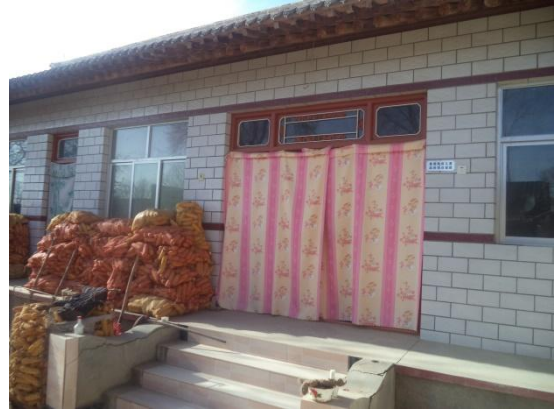
图为危房改造项目残疾人家庭危房改造前后对比