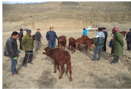
图为残疾人家庭牛羊发放项目