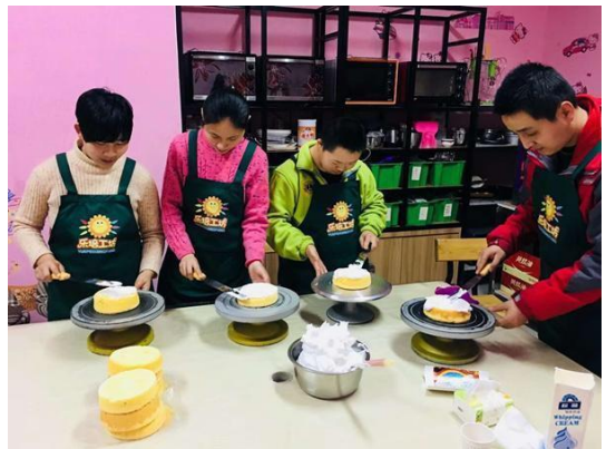
图为特教学捐建残疾儿童职业技能培训教室项目