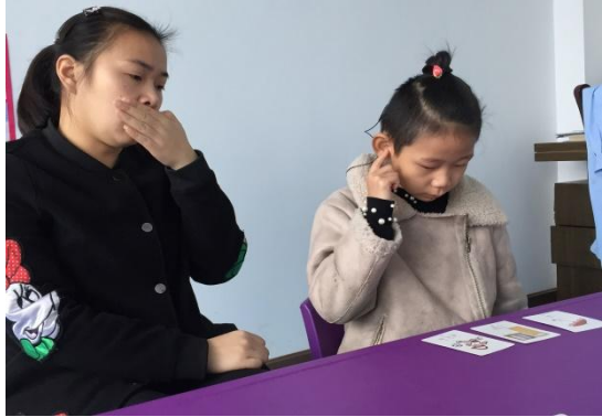
图为残疾儿童康复训练补贴项目