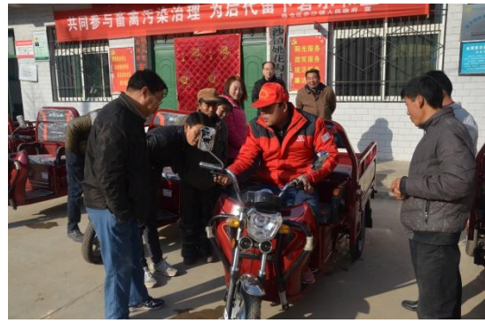
图为残疾人电动三轮车捐赠项目