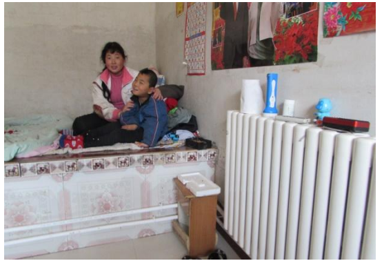
图为供暖设施改造项目