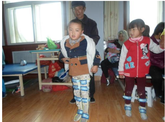
图为残疾儿童假肢矫形器适配项目