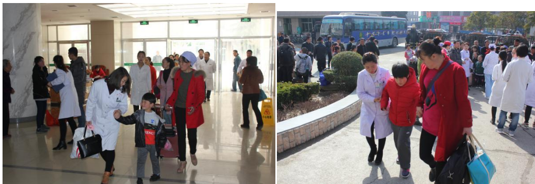
图为医生筛查患者